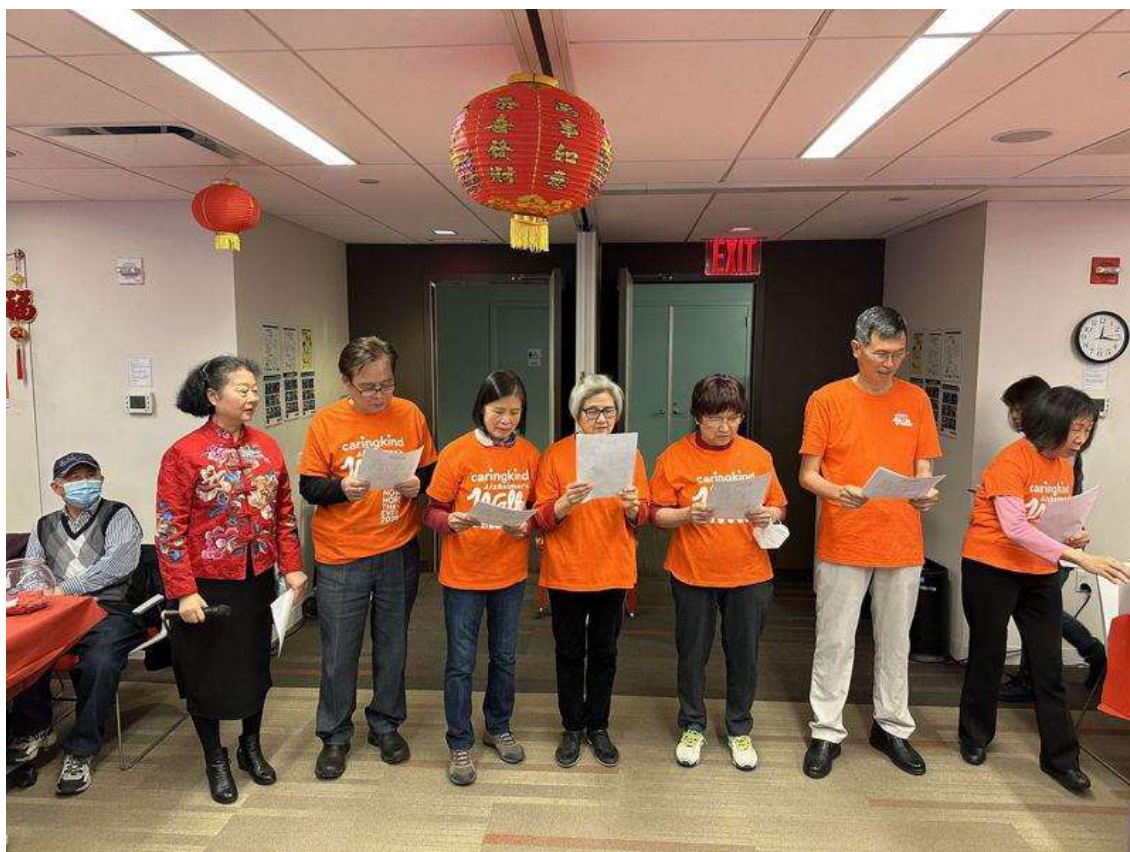
「星火義工隊」合唱。